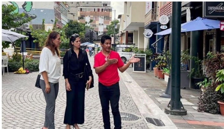
Grafica 11: Visita a la calle Panamá, marzo 2023

Como concejala de Guayaquil siempre generando espacios de participación ciudadana e impulsando el turismo de nuestra ciudad. Reunión con los representantes de la calle Panamá y visitas junto a diferentes instituciones de coordinación turística.