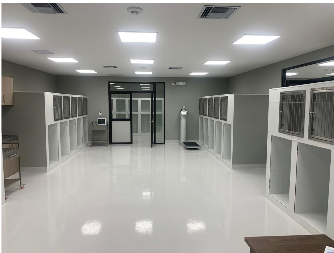
Gráfica 3: Instalaciones Internas del Centro de Bienestar Animal, Dic 2022