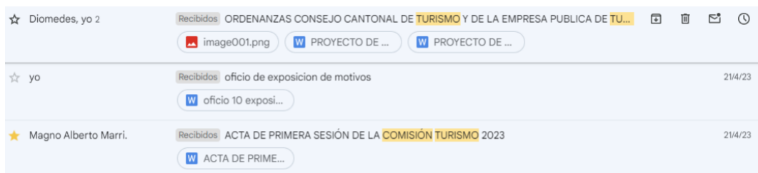
Gráfica 8: Correos sobre los proyectos de ordenanza propuestos, abril 2023

El segundo proyecto de Ordenanza obedece a lograr una mayor participación ciudadana en lo relativo a la planificación del turismo de la ciudad, donde los representantes del sector privado y la academia que son quienes tiene el conocimiento, el profesionalismo y la experiencia para aportar de manera técnica en el desarrollo de la industria y por supuesto en conjunto con el sector público local (quienes tienen la competencia de turismo), y nacional con quienes se coordina los planes de promoción y las políticas públicas.