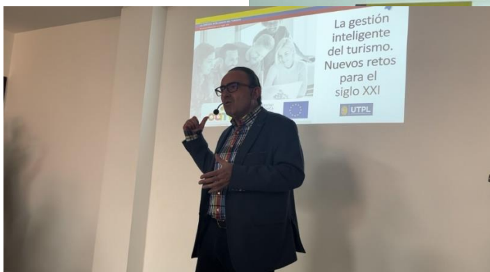
Gráfica 16: Seminario con la Universidad Politécnica de Valencia. O City “Turismo Inteligente”, abril 2023