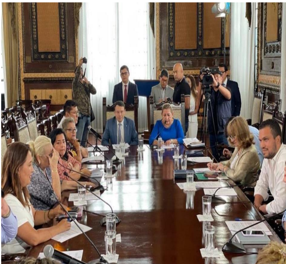
Gráfica 1: Sesión del M.I. Concejo M. de Guayaquil, febrero de 2023

A partir del mes de febrero de 2023 nos incorporamos a nuestras funciones para las cuales fuimos electos.