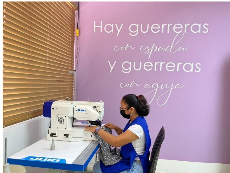
Gráfica 5: Usuaria del programa “A Puntadas”