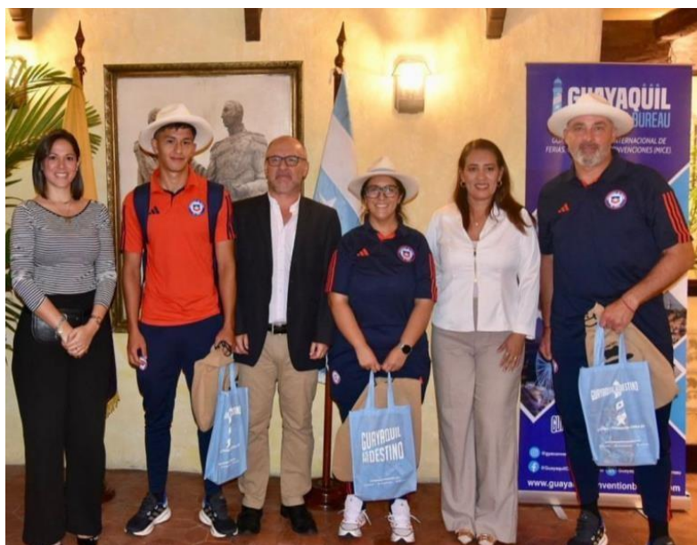
Grafica 12: Campeonato Sudamericano, marzo de 2023