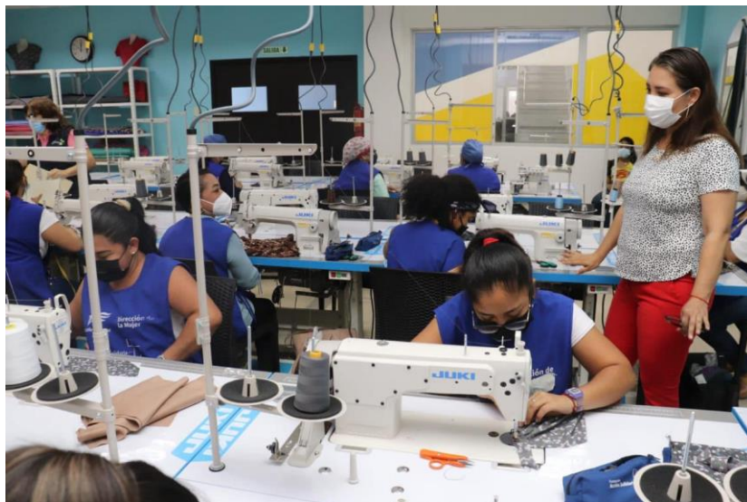
Grafica 4: Visita a la operación del proyecto “A Puntadas”

Cumplimos así con la propuesta de campaña Componente No. 1 Guayaquil Camino de Progreso, Objetivo específico No. 6 “Fortalecer la capacidad productiva de la población generando acceso a mayores oportunidades.....”