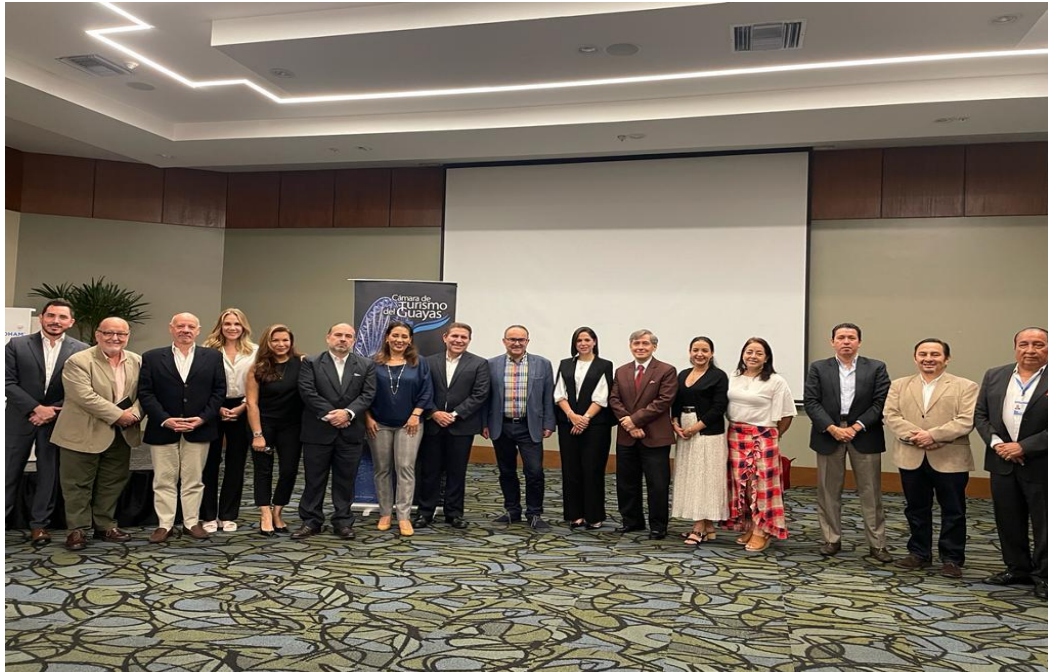
Grafica 15: Seminario con la Universidad Politécnica De Valencia. O City “Turismo Inteligente”, abril 2023