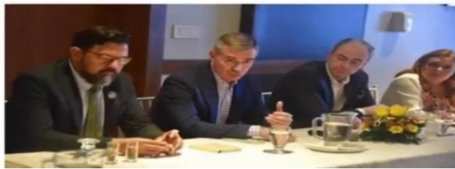
Grafica 7: Reunión del Sector Turístico, marzo 2023

El segundo proyecto de Ordenanza obedece a lograr una mayor participación ciudadana en lo relativo a la planificación del turismo de la ciudad, donde los representantes del sector privado y la academia que son quienes tiene el conocimiento, el profesionalismo y la experiencia para aportar de manera técnica en el desarrollo de la industria y por supuesto en conjunto con el sector público local (quienes tienen la competencia de turismo), y nacional con quienes se coordina los planes de promoción y las políticas públicas.