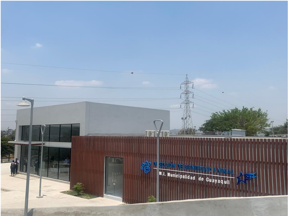
Gráfica 2, Centro de Bienestar Animal Municipal de Guayaquil, Dic 2022