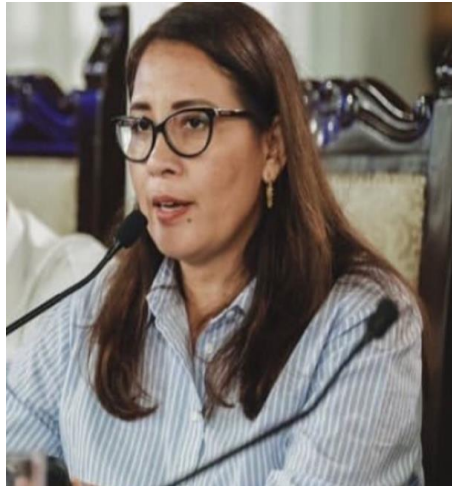
ULTIMA SESION DE CONCEJO M. DE GUAYAQUIL, mayo 2023