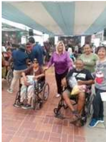
Ilustración 2.- Recibiendo varios petitorios de la ciudadanía de varios sectores