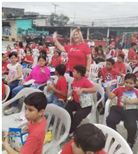
Ilustración 7.- Entrega de Desayunos Nutritivos en Navidad

ACTIVIDAD: ENTREGA DE DESAYUNOS NUTRITIVOS NAVIDEÑOS LUGAR: Mapasingue Este A08 FECHA: 16/12/2023 BENEFICIARIOS: 250 NIÑOS