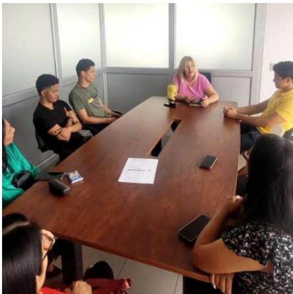
Ilustración 10.- Entrega de Becas de diversos Institutos Tecnológicos Superiores