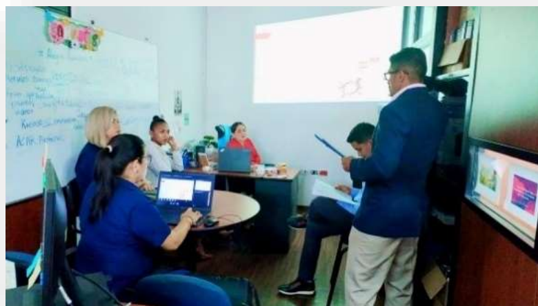
Ilustración 4.- Socialización del proyecto "Aprendiendo a vivir, Dejando Huellas un Día a la Vez"