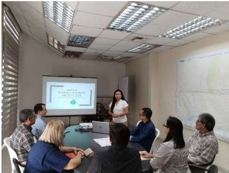
Ilustración 5.- Socialización del proyecto "Guayaquil se Hidrata"