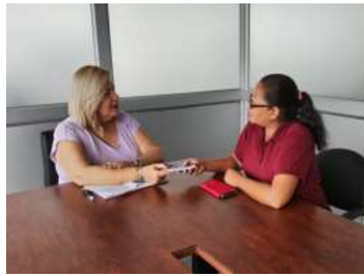
Ilustración 1.- Recibiendo varios petitorios de la ciudadanía de varios sectores