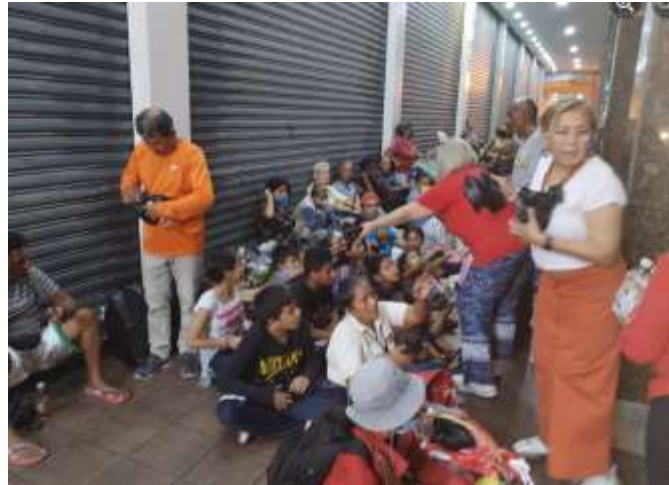
Ilustración 8.- Entrega de Cenas