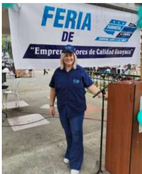
Ilustración 10.- Primera Feria de Emprendedores de Calidad Guayaca