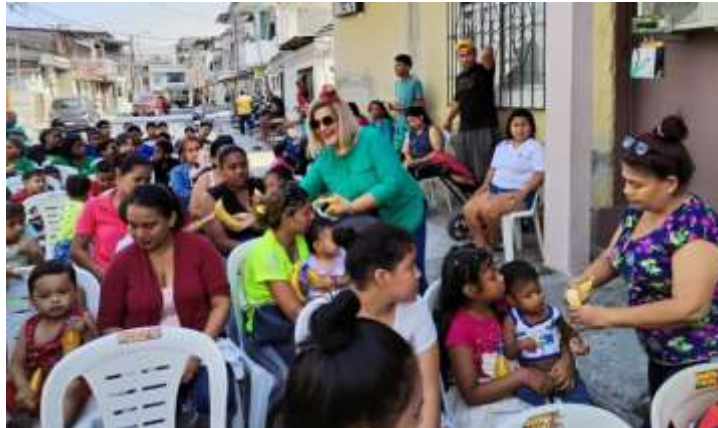
Ilustración 6.- Entrega de Desayunos Nutritivos en Navidad

ACTIVIDAD: ENTREGA DE DESAYUNOS NUTRITIVOS NAVIDEÑOS LUGAR: La Chala – sector A07 FECHA: 02/12/2023 BENEFICIARIOS: 250 NIÑOS