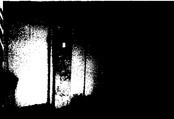
HALL-E INGRESO, ASCENSORES DEL EDIFICIO ALFIL