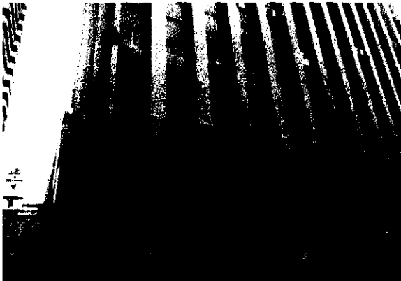
VISTA DEL EDIFICIO ALFIL QUE CONTIENE LA OFICINA